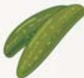
kwaśny (kiszony ogórek i kiszona kapusta)